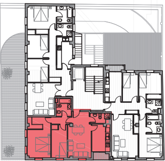
Planta PRIMERA general