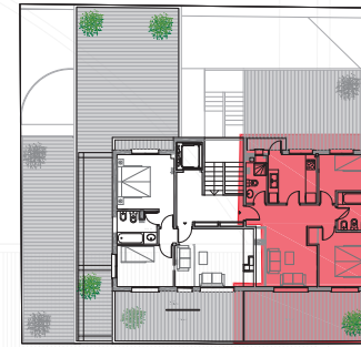
Planta ÁTICO general